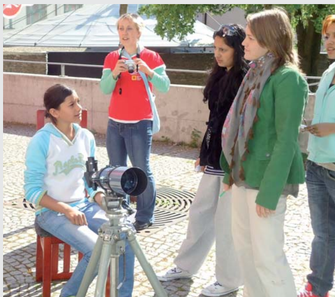
Mezinárodní den rodiny

Aby se společnost nebála zúčastnit „cikánské“ akce, aby si zástupci měst uvědomili, že Ro-