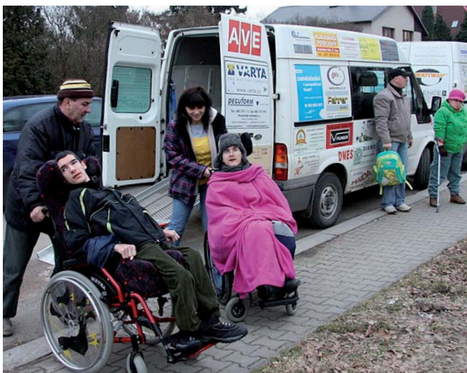
Sociální automobil je každodenní pomocnou rukou.

tel.: +420 487 829 871 mob.: +420 774 116 412 e-mail: medializace@fchcl.cz