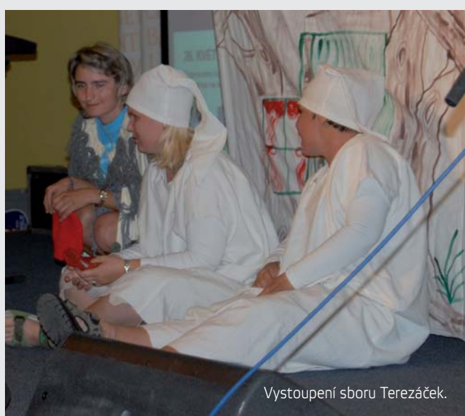
Vystoupení sboru Terezáček.