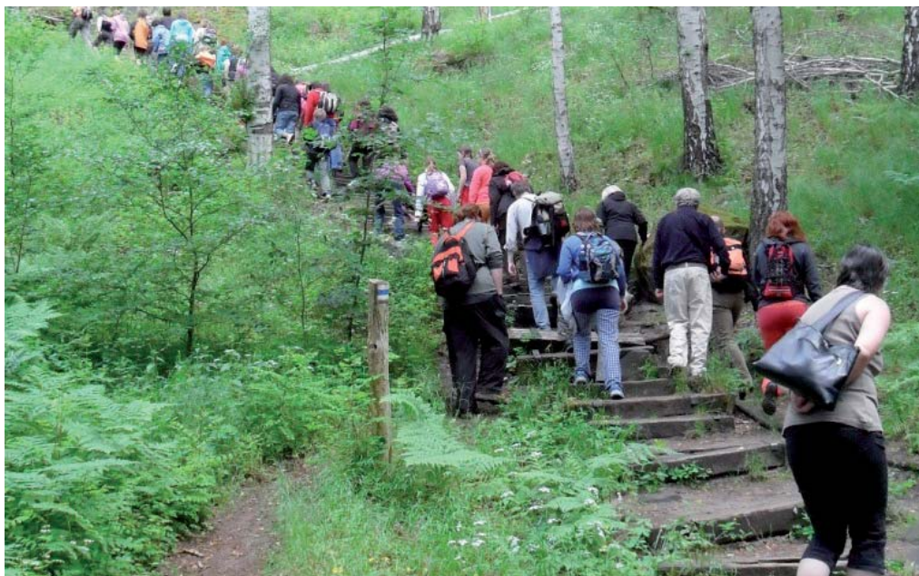
Výlet na Drábské světničky spěstřilo dobré počasí a hledání ukrytých krabiček s různými drobnostmi.

Sobotní ráno dalo všem přítomným naději, že bude hezký den. Místní autodopravce přepravil všechny účastníky do vesnice Dneboh, kde již čekali „kačeři“ Michal s Janou. Oba mladí lidé, kteří se věnují geocachingu zasvětili přítomné do této aktivity. Vysvětlili její počátky a principy. Dětem zapůjčili GPS navigace a společně jsme se všichni vydali do Drábských světniček hledat „keše“ – ukryté krabičky, které obsahují různé drobnosti a seznam „kačerů“, kterým se podařilo je objevit. Po návratu do rekreačního střediska využila většina dětí i rodičů místní krytý bazén. Po večeri se z přítomných staly zaměstnanci stavebních firem, kteří z bonbonů marschmalow a špaget navrhovali a stavěli pozoru-