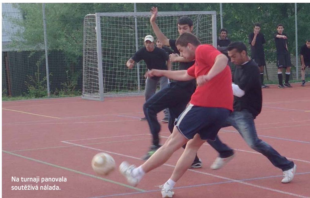
Na turnaji panovala soutěživá nálada.

Akce se konala v rámci individuálního projektu „IP1 – Služby sociální prevence v Libereckém kraji“, který je financován z Evropského sociálního fondu z Operačního programu Lidské zdroje a zaměstnanost rp