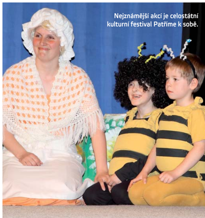
Nejnámější akcí je celostátní kulturní festival Patříme k sobě.

diční přímořské i tuzemské pobyty, a řadu dalších. Druhým cílem bylo pořádat exkurze a semináře pro zaměstnance nových zařízení, zdravotnických, školských i sociálních, aby mohli čerpat zkušenosti. Důležitá byla a je i integrace hendikepovaných do většinové společnosti. Šlo o to připravit takové aktivity, na nichž by se – tehdy nově – vedle ostatních dětí s naprostou samozřejmostí objevovaly děti s různými typy zdravotního postižení. Z hlediska integrace je důležitý celostátní kulturní festival Patříme k sobě, jehož 14. ročník proběhl v dubnu letošního roku. Dále organizujeme každoroční sportovní setkávání osob se zdravotním postižením nazvané Krakonošův trojboj. Třikrát do roka se mohou zájemci účastnit odpoledních „Taneční čajů.